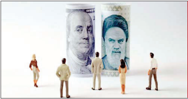
दुनिया की ताकतों के साथ ईरान के परमाणु करार के समय एक रियाल का भाव एक अमेरिकी

तेहरान (एपी)। अमेरिका के राष्ट्रपति चुनाव में डोनाल्ड ट्रंप की जीत के बाद ईरान की मुद्रा रियाल बुधवार को अपने सर्वकालिक निचले स्तर पर आ गई। कारोबार के दौरान डालर के मुकाबले ईरान की मुद्रा ईरानी रियाल का भाव 42092 प्रति डालर पर फिसल गया। गौरतलब है कि वर्ष 2015 में