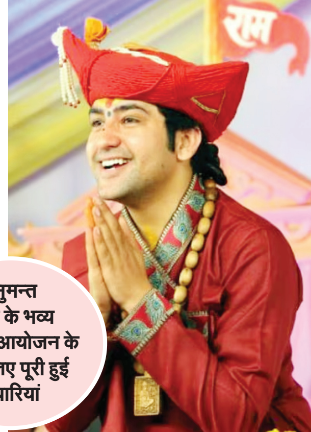
हनुमन्त कथा के भव्य विशाल आयोजन के लिए लिए पूरी हुई तैयारियां