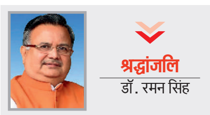
श्रद्धांजलि डॉ. रमन सिंह