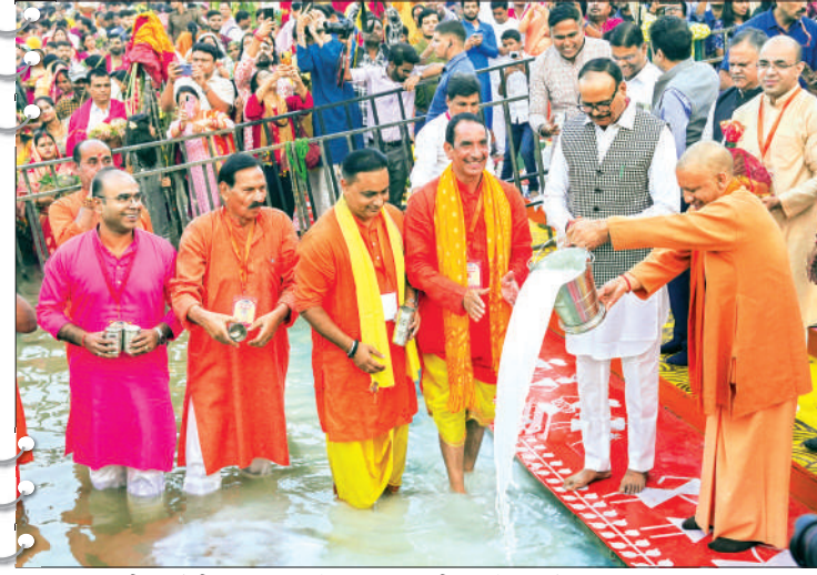
प्रयागराज। सीएम योगी आदित्यनाथ ने अस्ताचलगामी सूर्य देवता को अर्घ्य दिया।