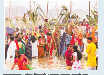
प्रयागराज। गंगा किनारे श्रद्धालु पूजन करते हुए।