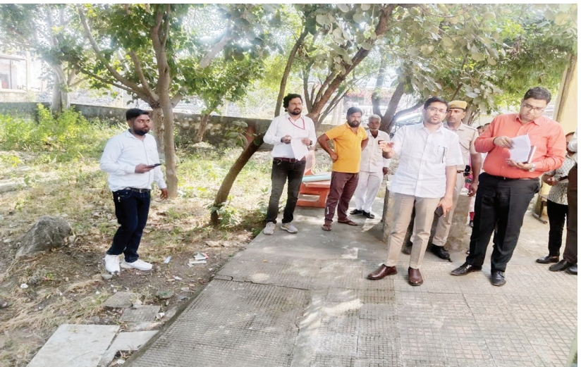
निर्माण, हैंडपंप लगवाने सहित विभिन्न परिषेदनाओं के 20 से अधिक प्रकरणों का

त्रिस्तरीय जनसुनवाई व्यवस्था के अंतर्गत ग्राम पंचायत स्तर पर आयोजित जनसुनवाई में आमजन की समस्याओं को सुनने के लिए जिला कलक्टर नमित मेहता चीरखेड़ा ग्राम पंचायत पहुंचें। उन्होंने ग्रामीणों के पेयजल, बिजली, सड़को के मरम्मत, नाली निर्माण, भवन निर्माण, अतिक्रमण हटवाने, रमशान