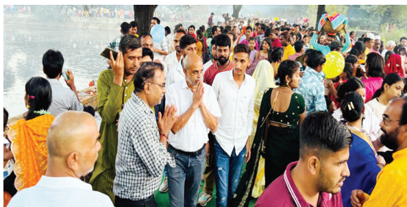
छठ पूजा के व्रत में परिवार सहित उपस्थित होकर फल, फूल, मिठाई, पुष्प व दिप प्रज्ज्वलन कर पूजा का विधान माना जाता है।