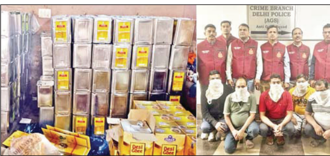
क्राइम ब्रांच के छापे में बरामद नकली घी और पुलिस की गिरफ्त में आरोपी।

नई दिल्ली (एसएनबी)। दिल्ली पुलिस की क्राइम ब्रांच ने हरियाणा के जींद में प्रमुख ब्रांडों के नाम पर नकली देसी घी बनाने की फैक्टरी का पर्दाफाश करते हुए पांच लोगों को गिरफ्तार किया है। यह फैक्टरी हरियाणा के जींद में चल रही थी।