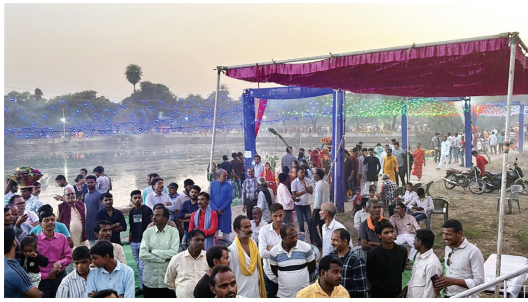
पर छठ माता की पूजा से सुख समृद्धि उन्नति का मार्ग प्रशस्त होता है, स्मरण रहे