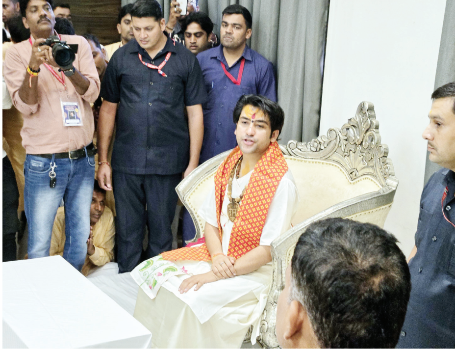
फैलता हम इस पर कोई व्यक्ति नहीं बोलता अब हिंदुओं को जागना पड़ेगा और हमारे त्योहारों को

राजनीति में यदि धर्म नहीं है तो राजनीति अंधी है। अभी के राजनेता धर्म का उपयोग करके राजनीति का वोट बैंक बना रहे ये मेरे देश सबसे बड़ा दुर्भाग्य है। दिव्य दरबार के बहाने हमें हिन्दुओं को एक करना है ना हमें सीधी चाहिए ना केवल और केवल सनातन धर्म की रक्षा करनी है। महाराज ने आगे कहा कि दीपावली त्यौहार पर पटाखे फोड़ेंगे तो प्रदूषण फैलता है मगर बकरे ईद के समय इतना खून खराब जीव हत्या होती है तब प्रदूषण नहीं फैलता हम इस पर कोई व्यक्ति नहीं बोलता अब हिंदुओं को जागना पड़ेगा और हमारे त्योहारों को