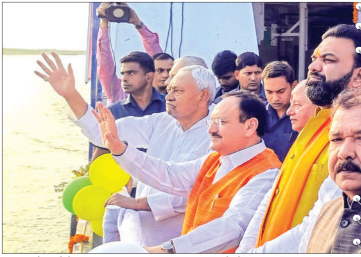
पटना। सीएम नीतीश कुमार, भाजपाध्यक्ष नरेंद्र और सम्राट चौधरी भी छठ पूजा में शामिल हुए।